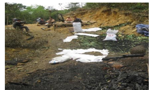
Hình 3. Khai thác gỗ rừng đốt lấy than củi

*Đốt than: Đốt than cũng là một trong những công việc đem lại thu nhập cho người dân vào thời điểm nông nhàn. Mặc dù ở Hà Giang hoạt động này không phổ biến như lấy ong hoặc lấy gỗ, nhưng nó cũng cũng là một trong những nguyên nhân không những gây cháy rừng mà còn mất rừng, có những địa điểm khó làm hầm đốt than, người dân chặt nguyên cây gỗ xuống và đốt ngay tại rừng gây cháy rừng rất nghiêm trọng.