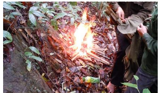
Hình 2. Chuẩn bị đốt ong ở Hoàng Su Phì

*Mang lửa vào rừng để khai thác mật ong: Khai thác mật ong là một trong những nguyên nhân gây cháy rừng khá lớn vì phải dùng lửa trực tiếp để đốt ong, hoạt động này xảy ra khá phổ biến ở huyện Hoàng Su Phì, Vị Xuyên, Yên Minh... và cũng đã được xác định là nguyên nhân gây lên nhiều vụ cháy rừng trên địa bàn tỉnh Hà Giang.