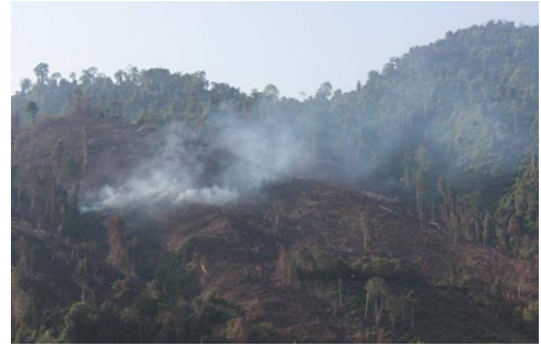
Hình 1. Đốt nương làm rẫy ở Hoàng Su Phì

*Đốt nương làm rẫy gần rừng dẫn đến cháy lan vào rừng: Các hộ gia đình sống gần rừng ở Hà Giang đều có nguồn thu nhập chính từ canh tác nương rẫy, các cộng đồng dân tộc sống ở Hà Giang đang phát đốt khá tự do, đó là nguyên nhân quan trọng gây lên cháy rừng. Tình trạng đốt nương làm rẫy diễn ra ở hầu khắp các cộng đồng và đã diễn ra trong nhiều năm.